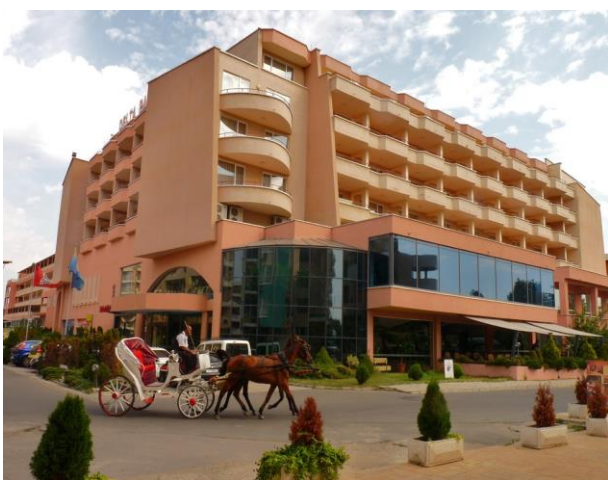
Hotel Delta Palace