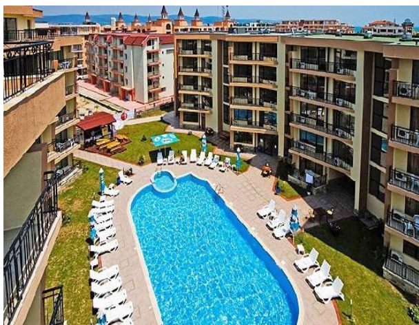
Hotel Sea Grace